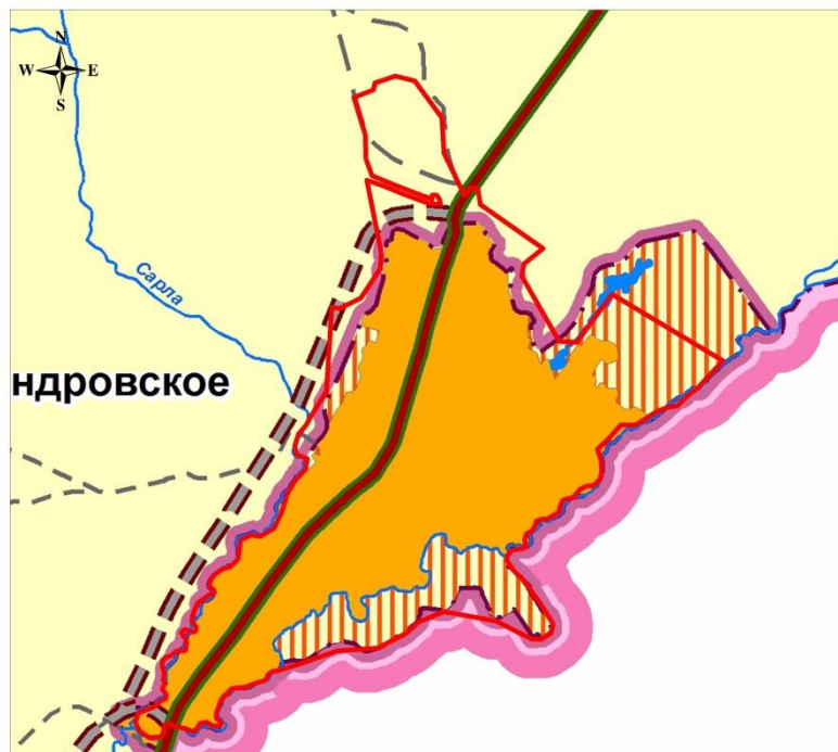
Карта границ населенных пунктов, входящих в состав поселения (Проект изменений в Генеральный план (с. Александровское))